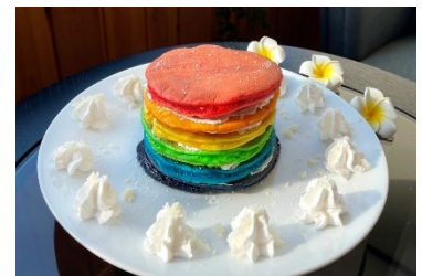
ALOHA Shirahama イメージ