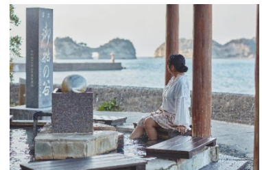
御船足湯 イメージ