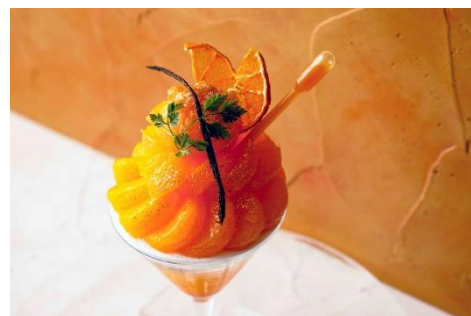
「和歌山まるごとみかんパフェ」イメージ

和歌山県産のみかんをフレッシュな状態だけでなくコンポートやゼリー、ソースなど様々なアレンジで丸ごとお楽しみいただける季節限定のパフェです。開放感あふれるラウンジで、ティータイムのスイーツやディナー後のメとして、和歌山県産みかんの魅力を堪能するパフェをお楽しみください。